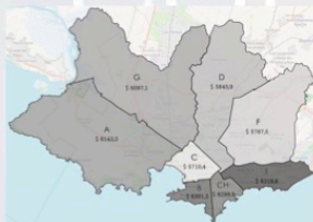
Imagen 1: Mapa de la ciudad de Montevideo con los costos de las CBAN por municipio.

*Municipios C,B y CH presentan entre 0,5 a 3,1% de hogares pobres, el E y G de 3,2 a 11,5%, y el A, D y F más de 11,6% (4)